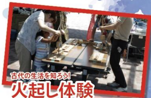
古代の生活を知ろう! 火起し体験