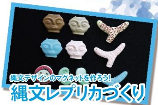
縄文デザインのマグネットを作ろう! 縄文レプリカづくり