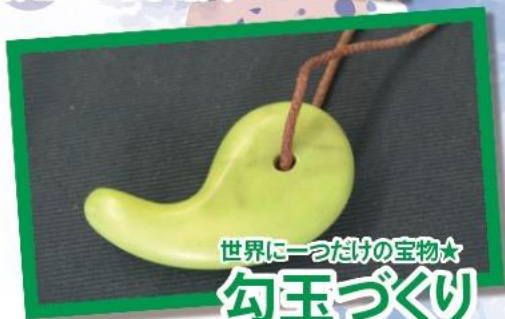
世界に一つだけの宝物★ 勾玉づくり