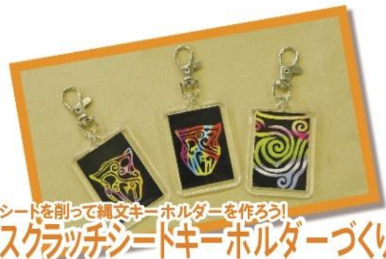
シードを削って縄文キーホルダーを作ろう! スクラッチシードキーホルダーづくり