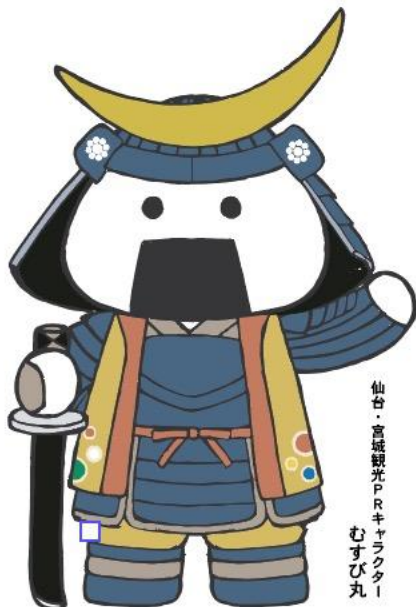
仙台・宮城観光PRキャラクター むすび丸