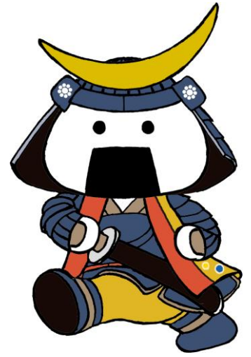
仙台・宮城観光PRキャラクター むすび丸